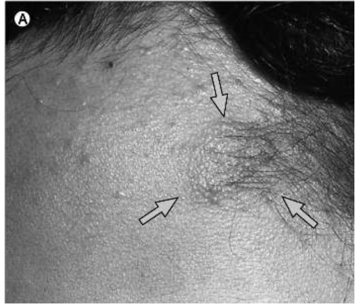
Afbeelding 2: Skin plaques