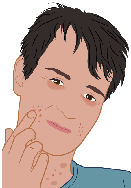
bultjes op de huid